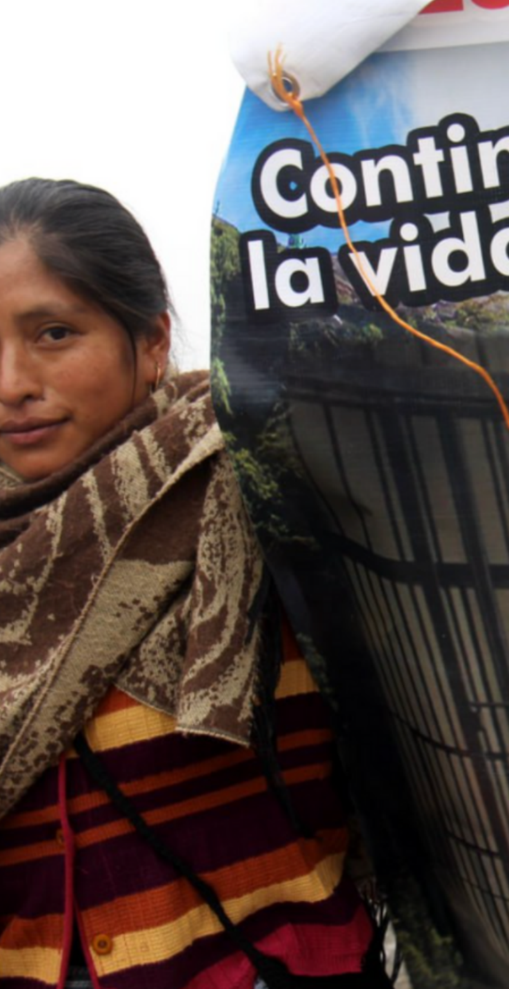
Foto de CPR Urbana, de actividad conmemorativa para la liberación de presos políticos defendiendo el territorio en 2016 en Huehuetenango.

"Exigimos al Gobierno de Guatemala y a las empresas nacionales e internacionales que cesen de inmediato toda amenaza de saqueo de nuestros bienes comunes, el secuestro, desvío y alteración de los ríos Chixoy, Copón y Cuatro Chorros para la construcción de las centrales hidroeléctricas antes mencionadas". (Miembro de ACODET)