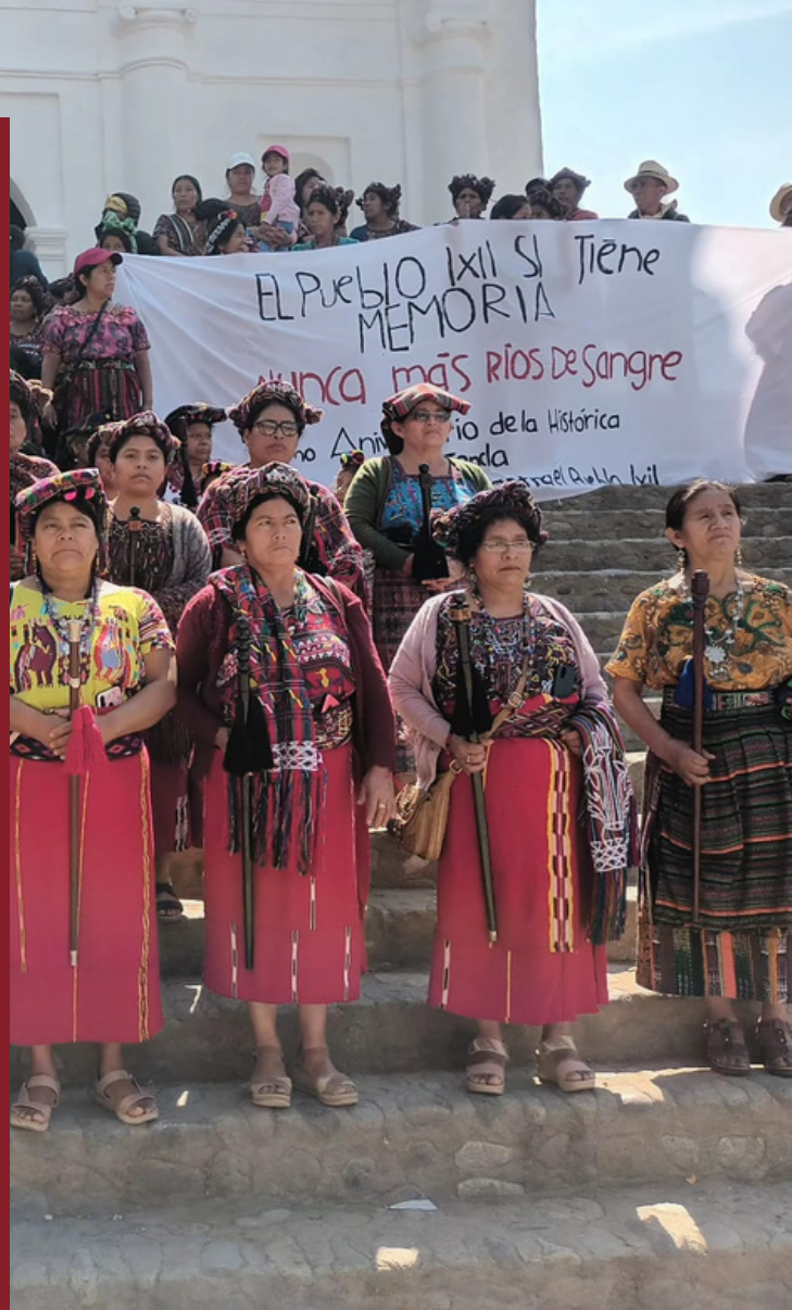
Caravana de la Memoria y la Justicia en el parque central de Chajul: recordaron el golpe de Estado de 1982, las masacres y el genocidio cometido por el ejército en las comunidades. 10 de mayo de 2023.

A los diez años de la histórica sentencia, familiares, sobrevivientes y organizaciones de derechos humanos le dicen a Guatemala y al mundo que se mantienen firmes en su búsqueda de justicia.