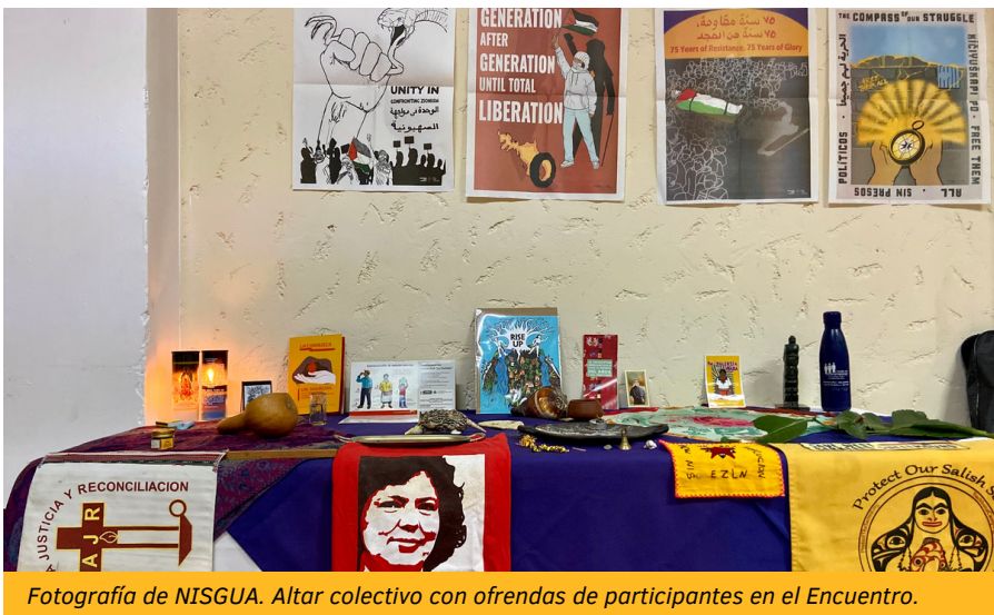
Altar colectivo con ofrendas de participantes en el Encuentro.

Dado el contexto político cada vez más intenso, la época de elecciones y el cansancio de sobrevivir múltiples formas de violencia estatal y capitalista, el Encuentro también fue un espacio sagrado para re-conectar con la memoria, genealogías de lucha, y con antiguos y nuevos compas de lucha.